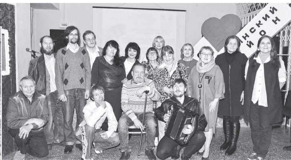
Делегация авторов из Красноярска

В селе Сива прошел II фестиваль-конкурс поэтического творчества «Старовойтовские встречи».