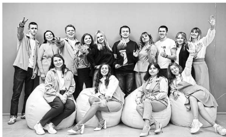
Коллектив центра «Молодежь Соликамска»